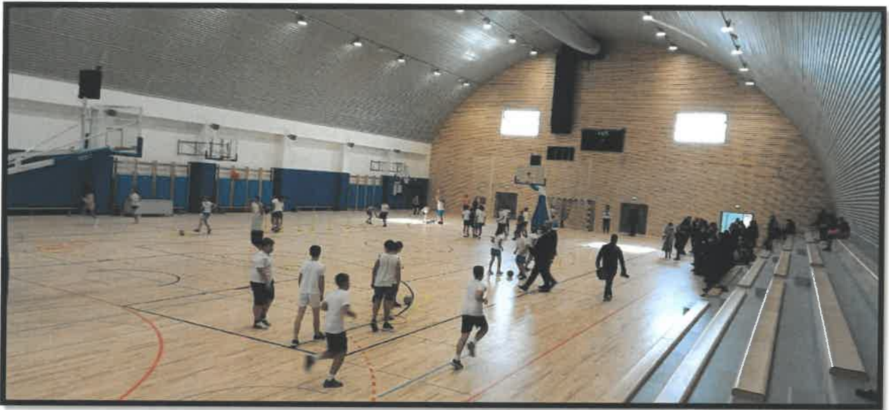
Slika 3. Sportska dvorana za vrijeme održavanja sata tjelesno-zdravstvene kulture

Osim za školske i izvanškolske aktivnosti, dvorana je pogodna za održavanje i ostalih oblika manifestacija. Dana 16. lipnja 2025. godine, Plesni Studio Mali i veliki održao je završnu godišnju plesnu produkciju.