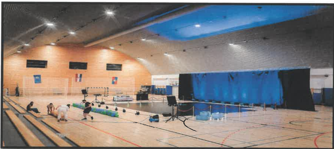
Slika 4. Plesna produkcija Plesnog studija Mali i veliki