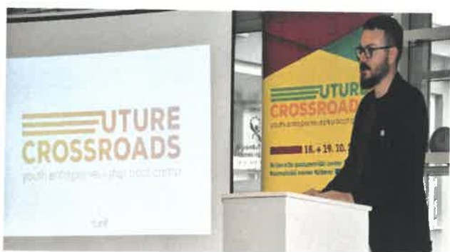
Slika 1. Future Crossroads event

Cilj ove usluge je pružanje kompletne besplatne informativne usluge svim zainteresiranim o projektima i programima u poduzetništvu.